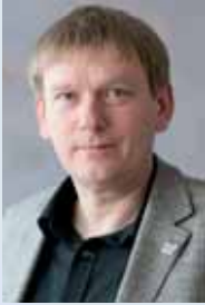
Landesbeauftragter Christian Dietrich, geb. 1965 in Jena, Theologe

Auf Basis des Thüringer Aufarbeitungsbeauftragtengesetzes vom 3. Juli 2013 hat der Thüringer Landesbeauftragte zur Aufarbeitung der SED-Diktatur (ThLA) als eine Einrichtung beim Thüringer Landtag folgenden Auftrag: