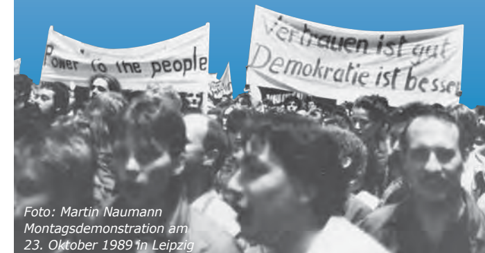
Montagsdemonstration am 23. Oktober 1989 in Leipzig