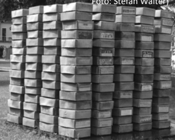
Denkmal für die Verfolgten 1945 - 1989

über die Einführung einer besonderen Ordnung an der Demarkationslinie